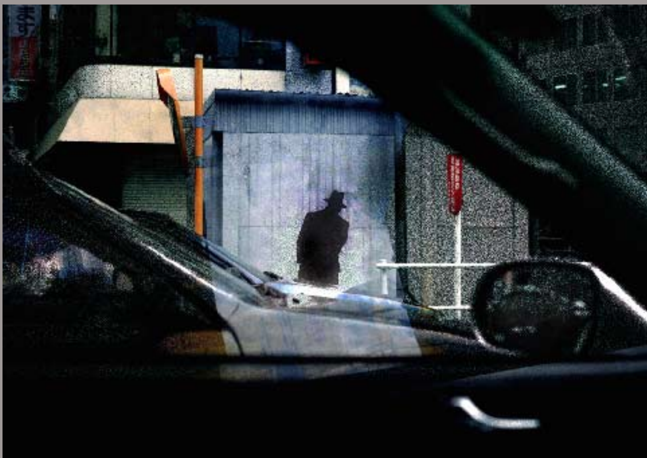
Advertising man, Tokyo, 1998 (Série "Car Maniac", The Globe Theater)