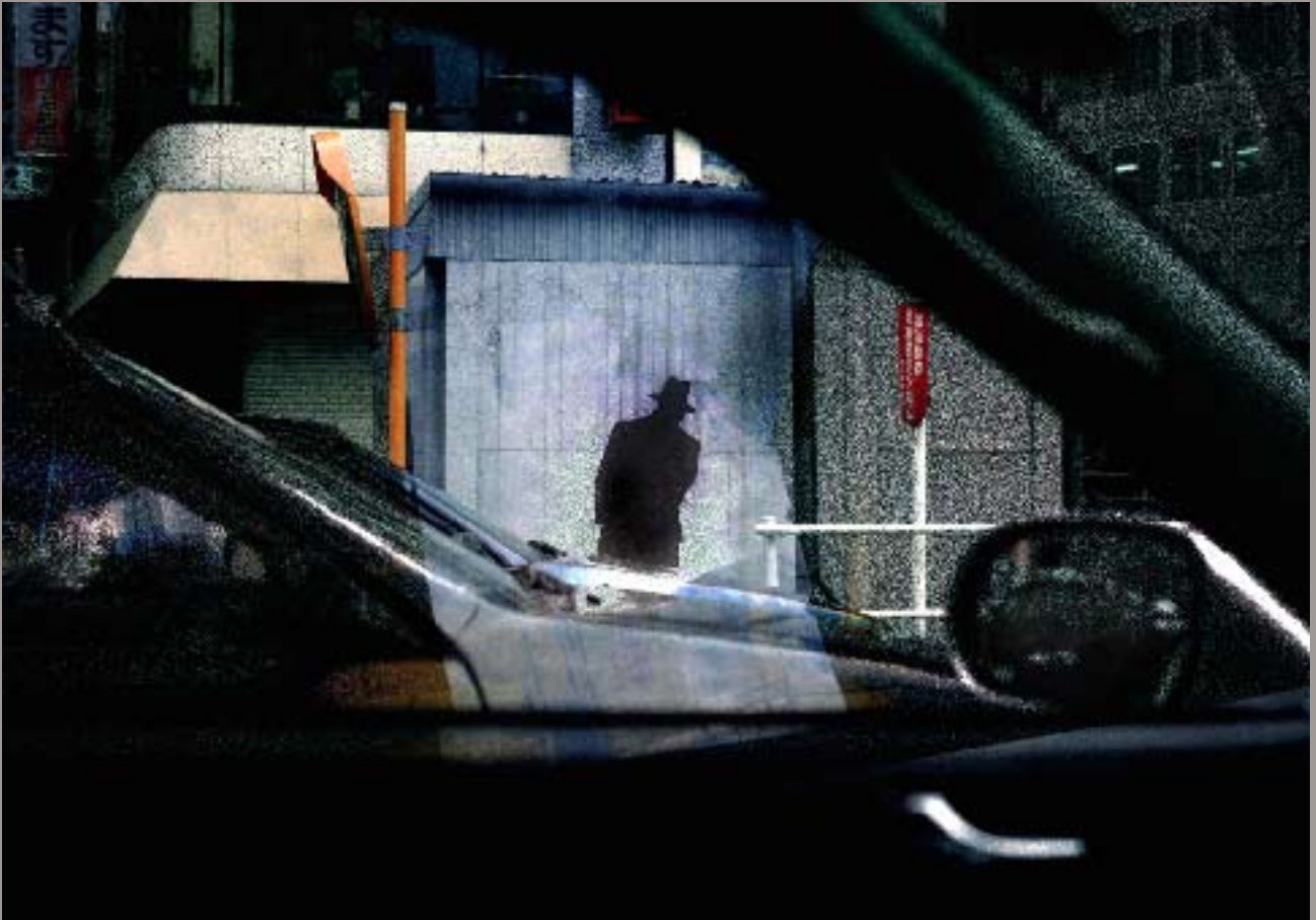
Advertising man, Tokyo, 1998 (Série "Car Maniac", The Globe Theater)