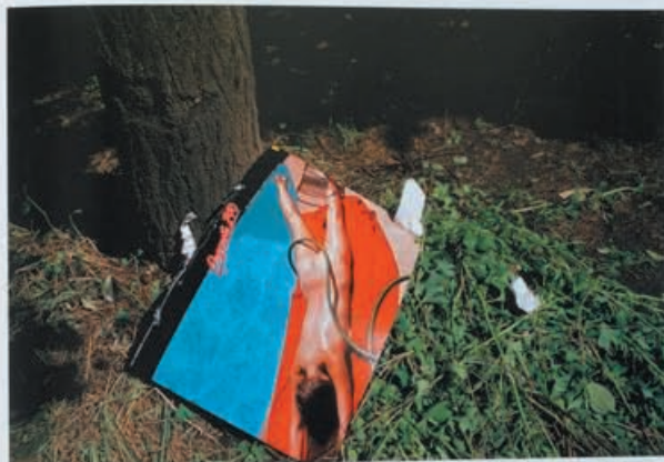
15 1998-1999 自然と人間の関係