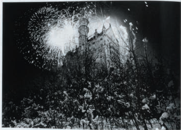
18 (MUSEUM) TOKYO 1946