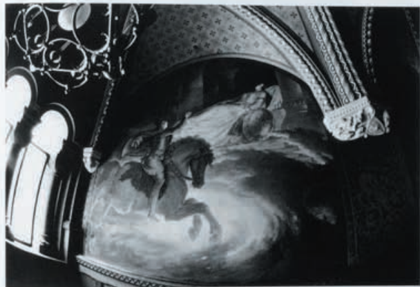
19 (BASSBY) 1976