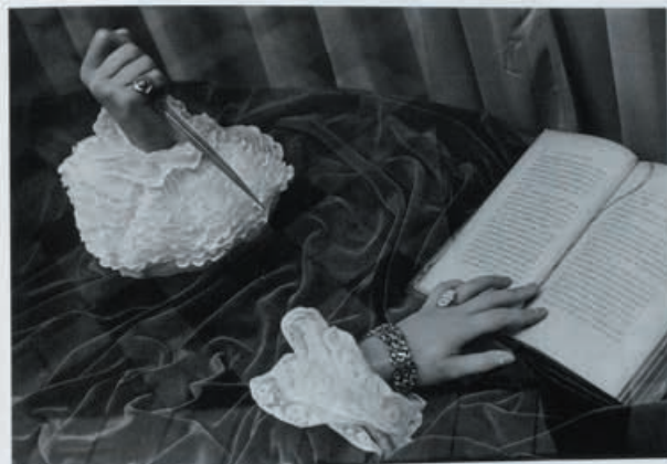
25 | 1999年 | 威尼斯 | 意大利