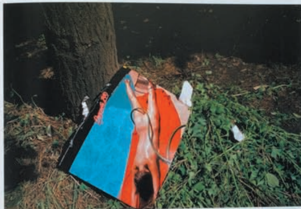
15 1993-02-27/28 香港藝術館 1993