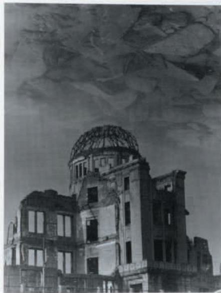
川田喜久治「アサヒ」1965年