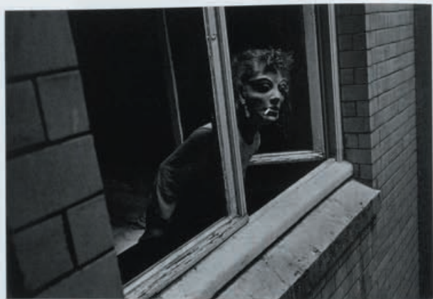
24 | 1999年 | 威尼斯 | 意大利